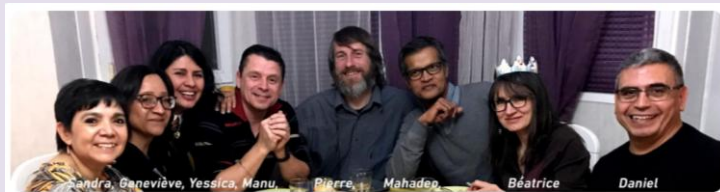
Es el grupo que mencionamos en nuestro boletín informativo enviado a mediados de marzo del 2020. Esta foto fue ingresada con el objetivo de que nuestros hermanos que oran por nuestro ministerio pongan rostros en los nombres de estas tres parejas. Ellos representan 3 hogares que abrieron sus puertas de sus departamentos, casas, para hablar de Jesús en reuniones convivenciales que se organizan una vez al mes, el segundo viernes de cada mes.